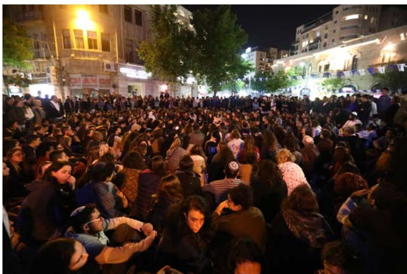
上百名學生湧入耶路撒冷廣場哀悼罹難者